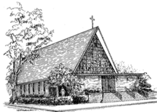
La Inmaculada Concepción