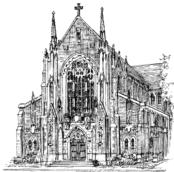
Nuestra Señora del Buen Consejo